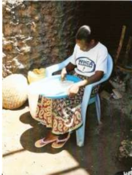
Hier werden Reiskörner ausgelesen.