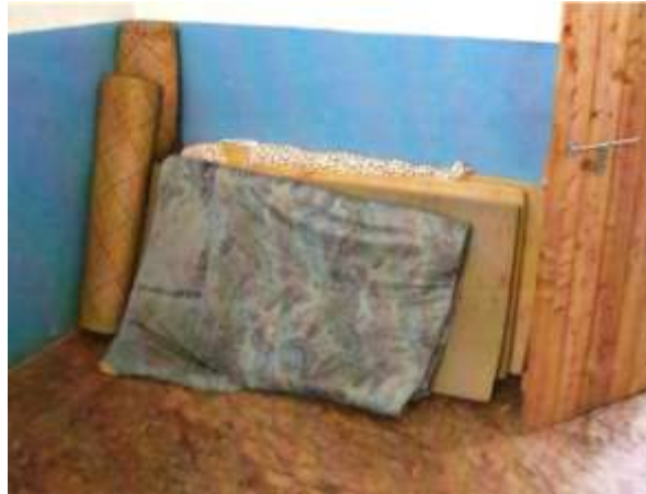
Ein Raum wird zum Schlafen mit Matratzen ausgelegt. Tagsüber werden diese an die Wand gelehnt.