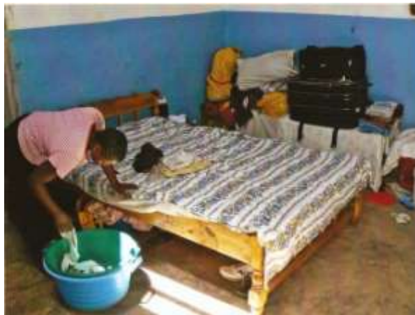
In diesem Bett schlafen fünf Kinder.