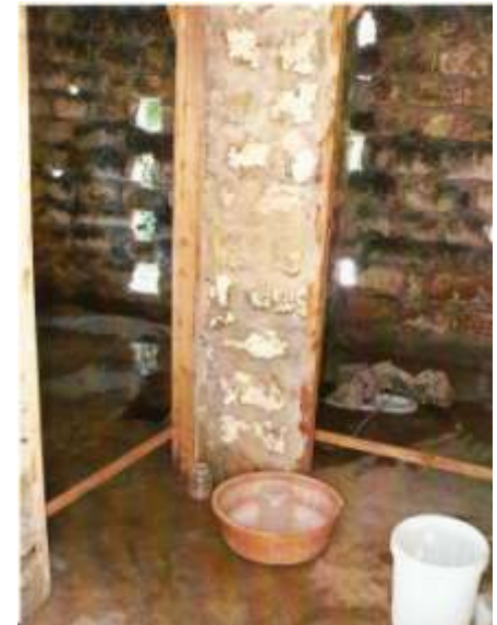
Dies ist die Toilette.