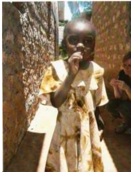
Ein kleines Mädchen.